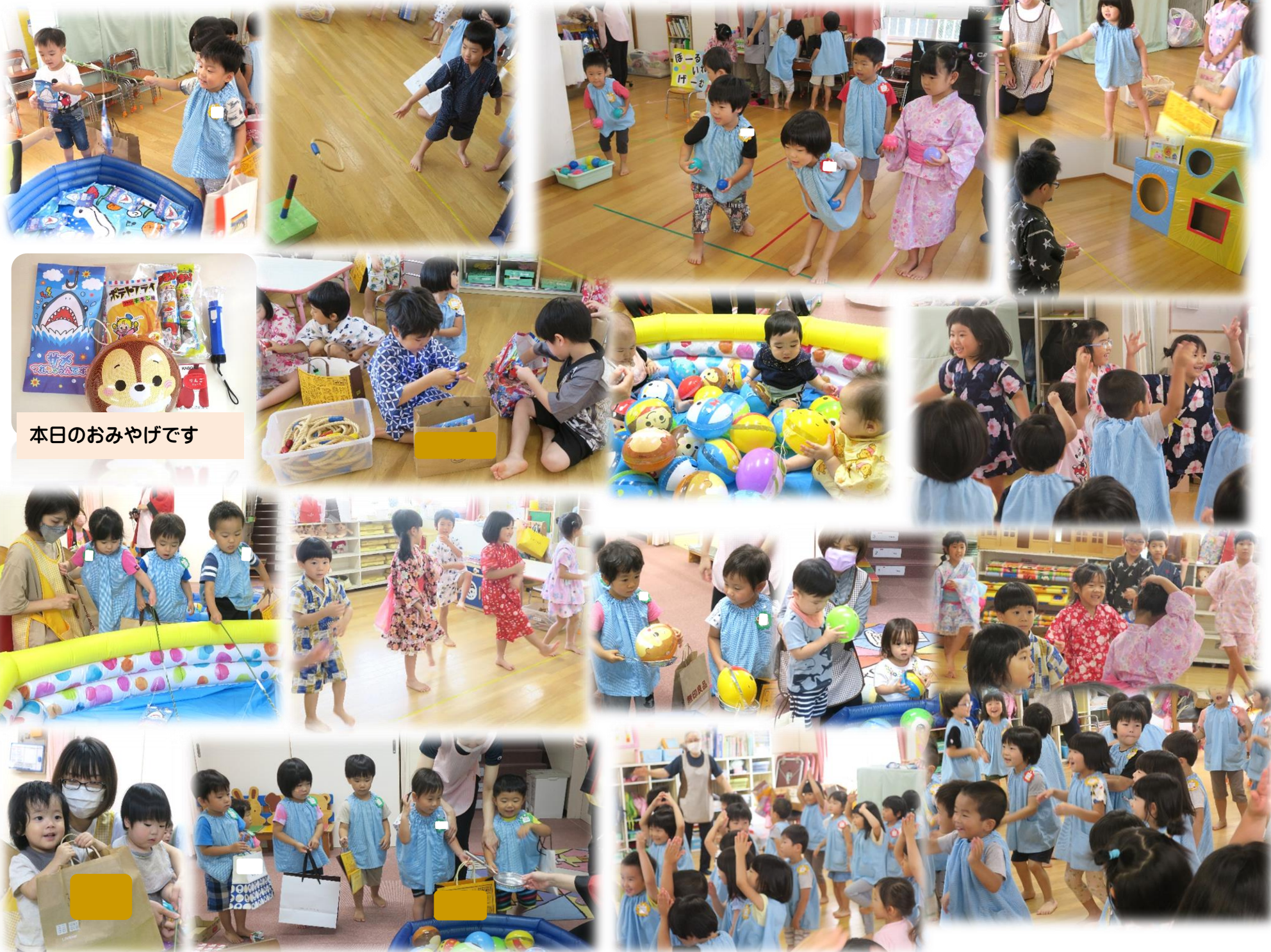
本日のおみやげです

ました。全園児が一緒にはできないので、3・4・5歳児クラスは合同で、あとは、各クラスで、少人数で楽しみました。最後には「おどるんようび」という大好きな曲に合わせて、思いっきり踊って笑って、体を動かしました。子どもたちの楽しそうな表情が、何より嬉しかったです。子どもたちの様子を掲載しておりますので、どうぞご覧ください！！保護者の皆様も、ご協力ありがとうございました。